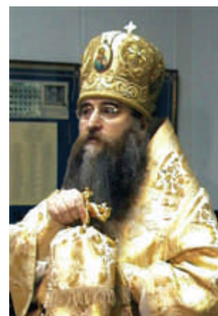
Преосвященнейший Лонгин, епископ Саратовский и Вольский на торжественном акте передачи собрания мощей.