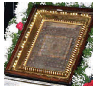
Мощевик в Свято-Троицком соборе