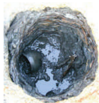
Находки перед извлечением из колодца.