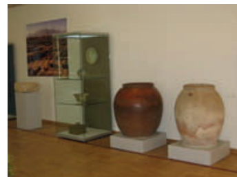
Хум. Золотая орда. XIV в.

Экспозиция включает свыше 860 памятников и предметов XIII - XV веков, созданных мастерами Золотой Орды. Из фондов Саратовского музея краеведения на выставке представлены интереснейшие экспонаты: шапочка «бокка» - головной убор знатной женщины, шелковые изделия и серебряный поясной набор из мавзолея Увекского городища, деревянный трехструнный музыкальный инструмент «комуз» из кургана близ с. Усть-Курдюм. Это единственная находка подобного музыкального инструмента в нашей стране. Она подтверждает, что комуз - один из наиболее архаичных дошедших до нас смычковых инструментов.